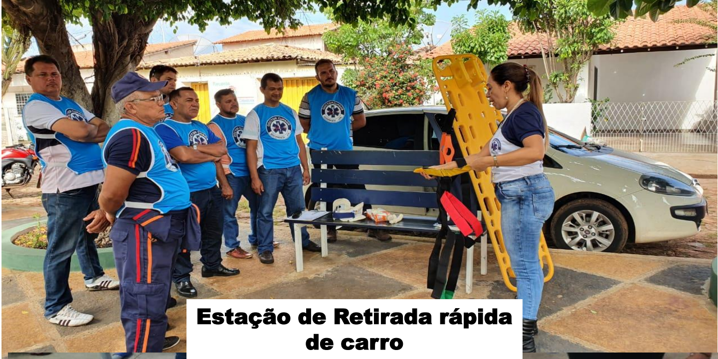
Estação de Retirada rápida de carro